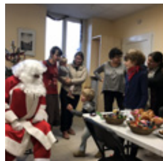
■ Le traditionnel arbre de Noël du foyer rural eu lieu le 22 décembre à la salle communale.