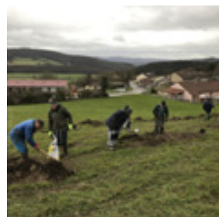
■ Quelques bénévoles ont procédé aux plantations d'arbres au verger de sauvegarde le 9 décembre