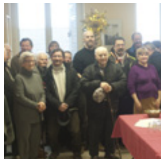
■ Le conseil municipal a présenté ses traditionnels vœux le dimanche 6 janvier autour d'un apéritif convivial.