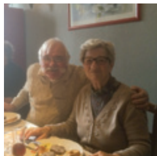
■ Les aînés se sont retrouvés le 20 janvier avec les conseillers municipaux pour le repas des anciens au restaurant le Montfleuri.