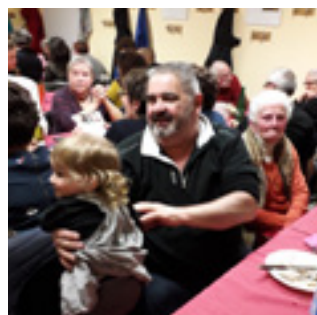
■ Le foyer rural organisait une soirée moules-frites le 2 février.