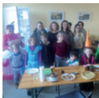
■ Le Carnaval a réuni petits et grands autour de gaufres et crêpes, le 24 février.