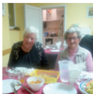
■ Repas d'hiver organisé par le foyer rural à la salle communale le 3 février.