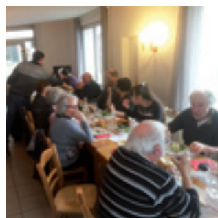
■ Repas des anciens au restaurant « les P'tits Bou' » à Saint-Julien le 21 janvier.