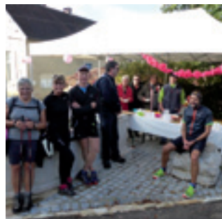
■ La marche contre le cancer du 22 octobre a attiré près de 250 randonneurs