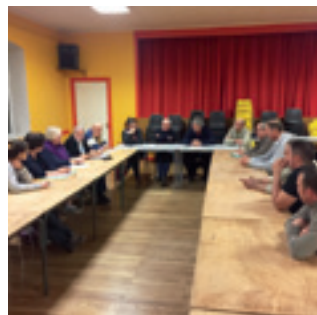
■ Le conseil municipal a rencontré les conseillers municipaux du Val Suran le 27 octobre pour débattre d'un éventuel regroupement.