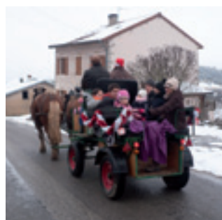
■ Balade en calèche avant la venue du père Noël pour petits et grands le 17 décembre.