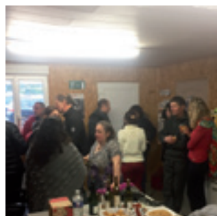
■ Boisson TP a accueilli les entrepreneurs de la commune le 18 novembre pour préparer le dossier de ce numéro.