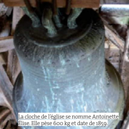
La cloche de l'église se nomme Antoinette Élise. Elle pèse 600 kg et date de 1859.